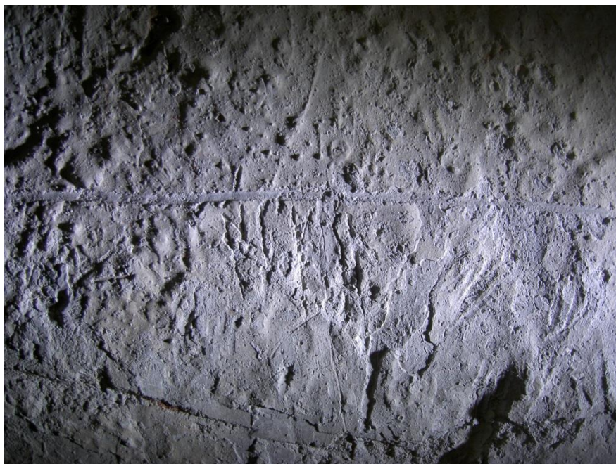
Fig. 2. Den nyfunna runristningen i Mästerby kyrka. Foto Magnus Källström 2010.